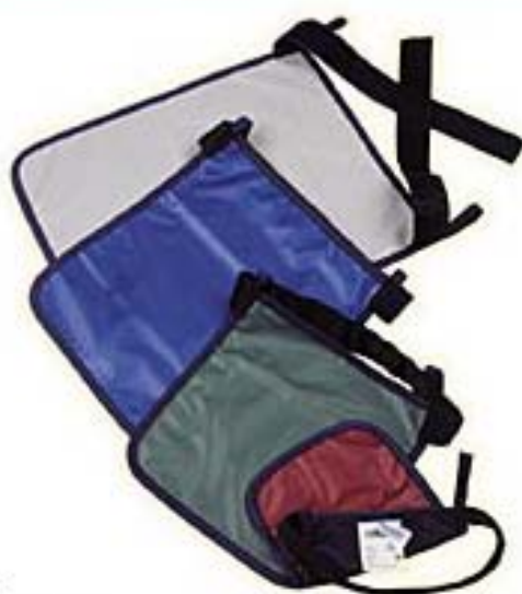
Grembiuli bacino Hip Aprons

PATENT'S X-RAY PROTECTIONS IN MEDICAL RADIOLOGY